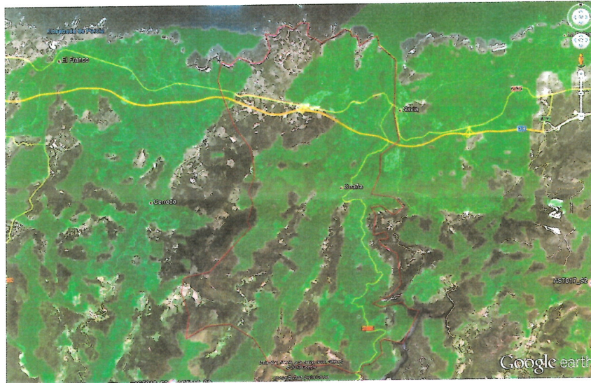
Figura 3 - Disponibilidad de WiMAX en Coaña

Quedamos a su disposición para cualquier aclaración adicional que consideren oportuna.