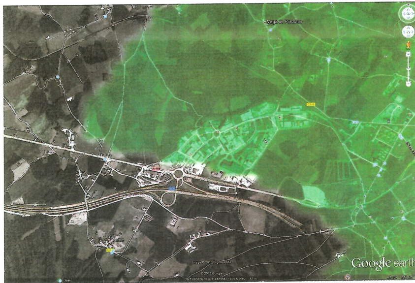
Figura 2 - Estimación de cobertura WiMAX